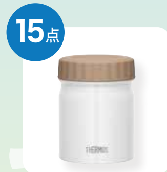
サーモス スープジャー