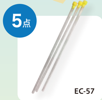
シゲミ ディスポーザブルタイプ NMRサンプルチューブ 3本