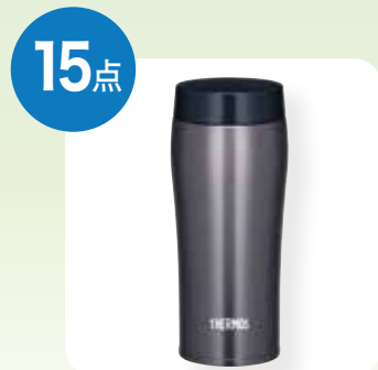
サーモス ケータイマグ