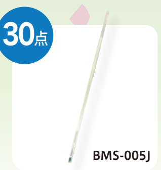
シゲミ 水溶液用対称 マイクロサンプルチューブ