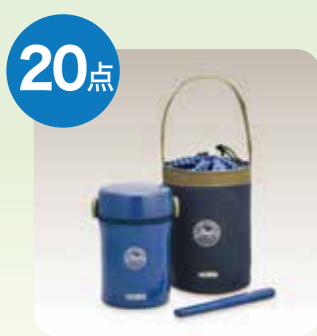
サーモス ステンレスランチジャー