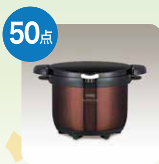
サーモス シャトルシェフ