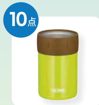
サーモス 保冷缶ホルダー